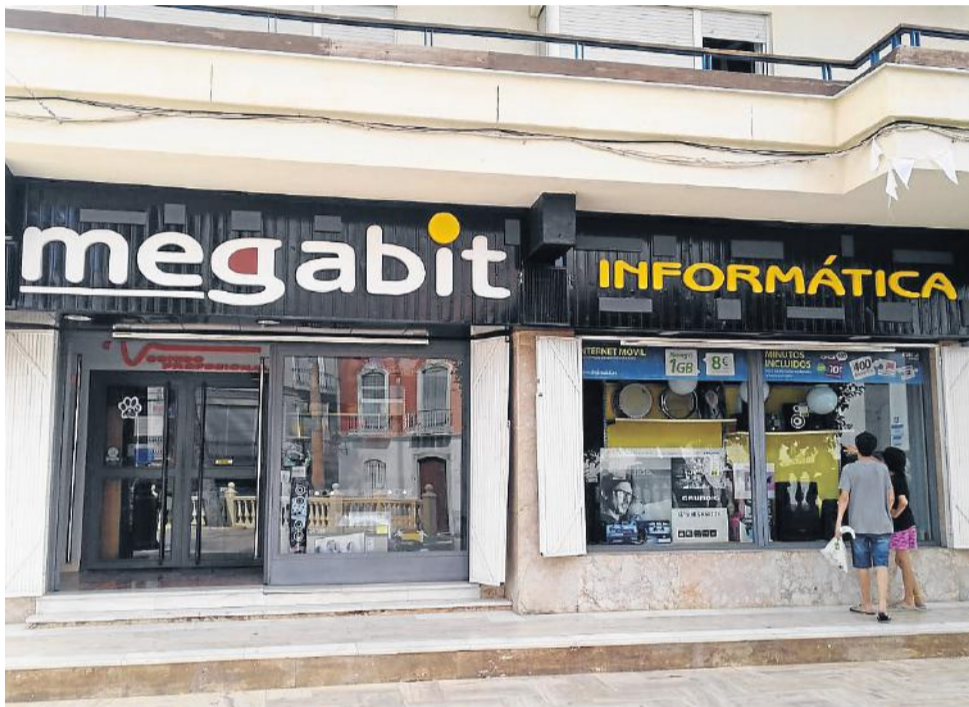
Tienda de informática en la Glorieta Sotomayor de Cuevas.