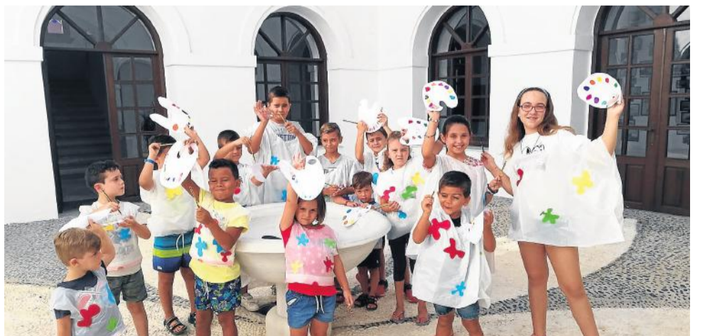
Pequeños artistas en el Convento de San Francisco.