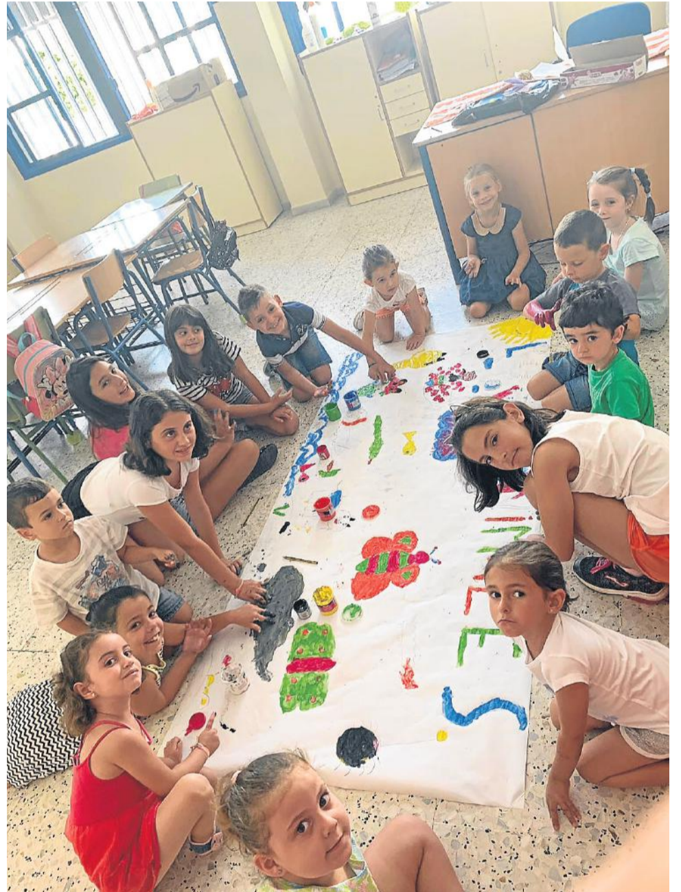
Murales para todos, trabajando en grupo, en Palomares.

La conciliación familiar y laboral es más sencilla en el verano cuevano, gracias al servicio de Escuelas de Verano que oferta el Ayuntamiento en el núcleo y en la pedanía de Palomares que facilita que los padres y madres puedan ir a trabajar con la tranquilidad de dejar a sus pequeños al cuidado de profesionales, en compañía de amigos, aprendiendo y divirtiéndose. Patines, juegos de mesa, convivencias, entretenimiento en el parque, piscina, manualidad, repostería... un sinfín de actividades es lo que siguen disfrutando los niños y niñas de las escuelas de verano tanto en el Convento de San Francisco como en el colegio de Palomares, instalaciones destinadas en estos meses a aprovechar estas semanas de vacaciones.