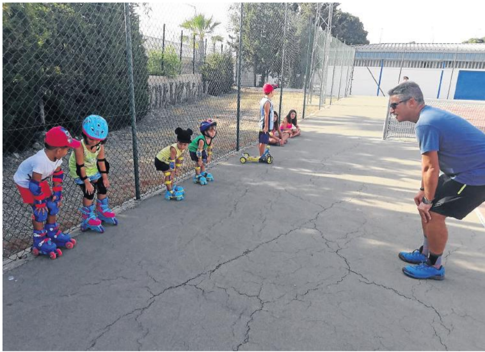
En Cuevas, aprendiendo a patinar.