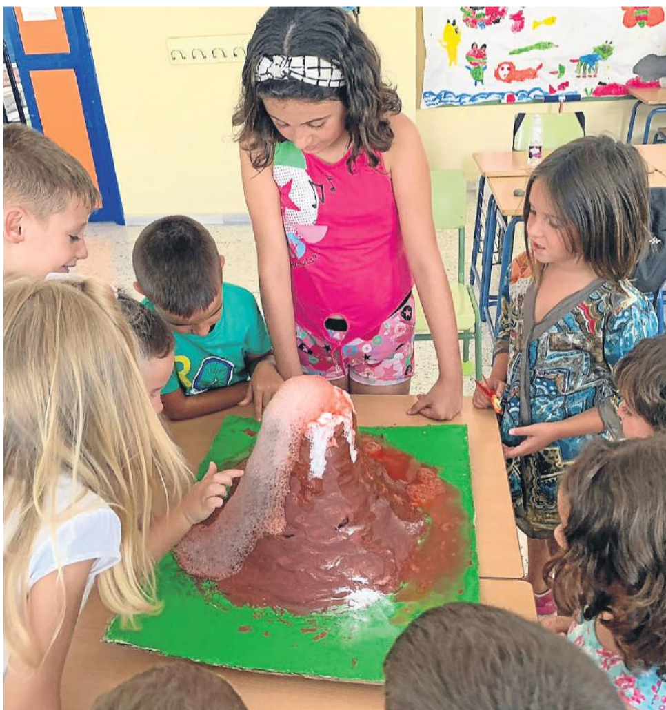
Descubriendo y experimentando con la ciencia, en Palomares.