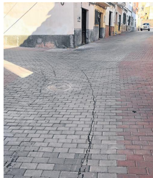
Imágenes del asfaltado en Los Conteros de Villaricos, en el camino del cementerio y adoquinado en el barrio de Las Maravillas.