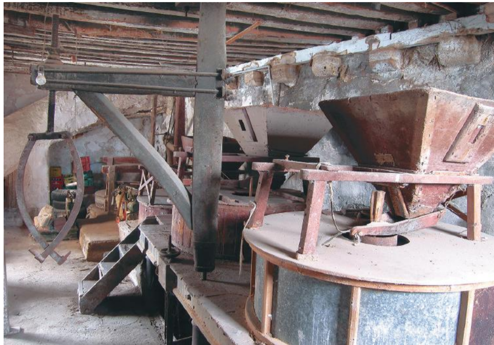
Fotografía del interior del Molino del Lugar, hecha varios años después de dejar de funcionar.

por la coincidencia de sus apellidos con los del militar.