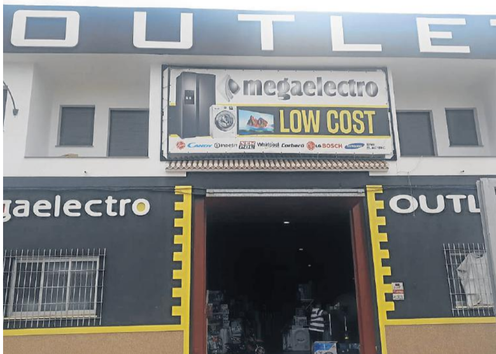
El gran establecimiento en la recta de Los Silos de la familia de Megabit.

La empresa Megabit Informática tiene en Cuevas del Almanzora uno de los establecimientos de esta rama de los más conocidos. Ofrecen diversidad de servicios, además de tener venta de todo tipo de productos informáticos.