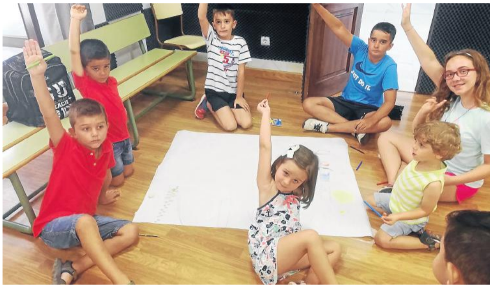
Divirtiéndose con las propuestas de las monitoras.