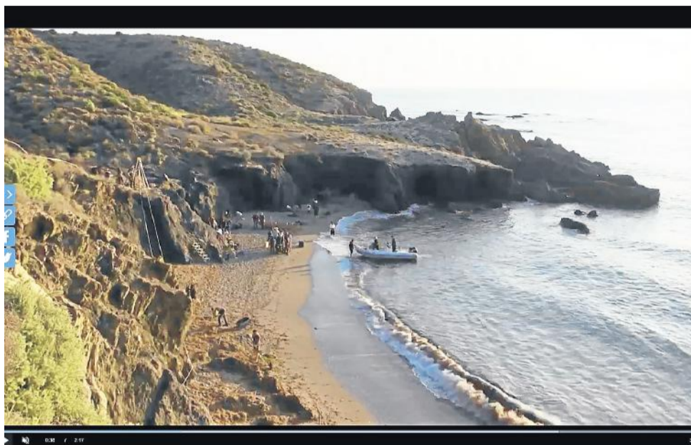
Fragmento del avance de la Segunda Temporada de La Peste, en una playa de Cuevas del Almanzora.

La Cala del Mal Paso y la del Peñón Cortado, los escenarios elegidos