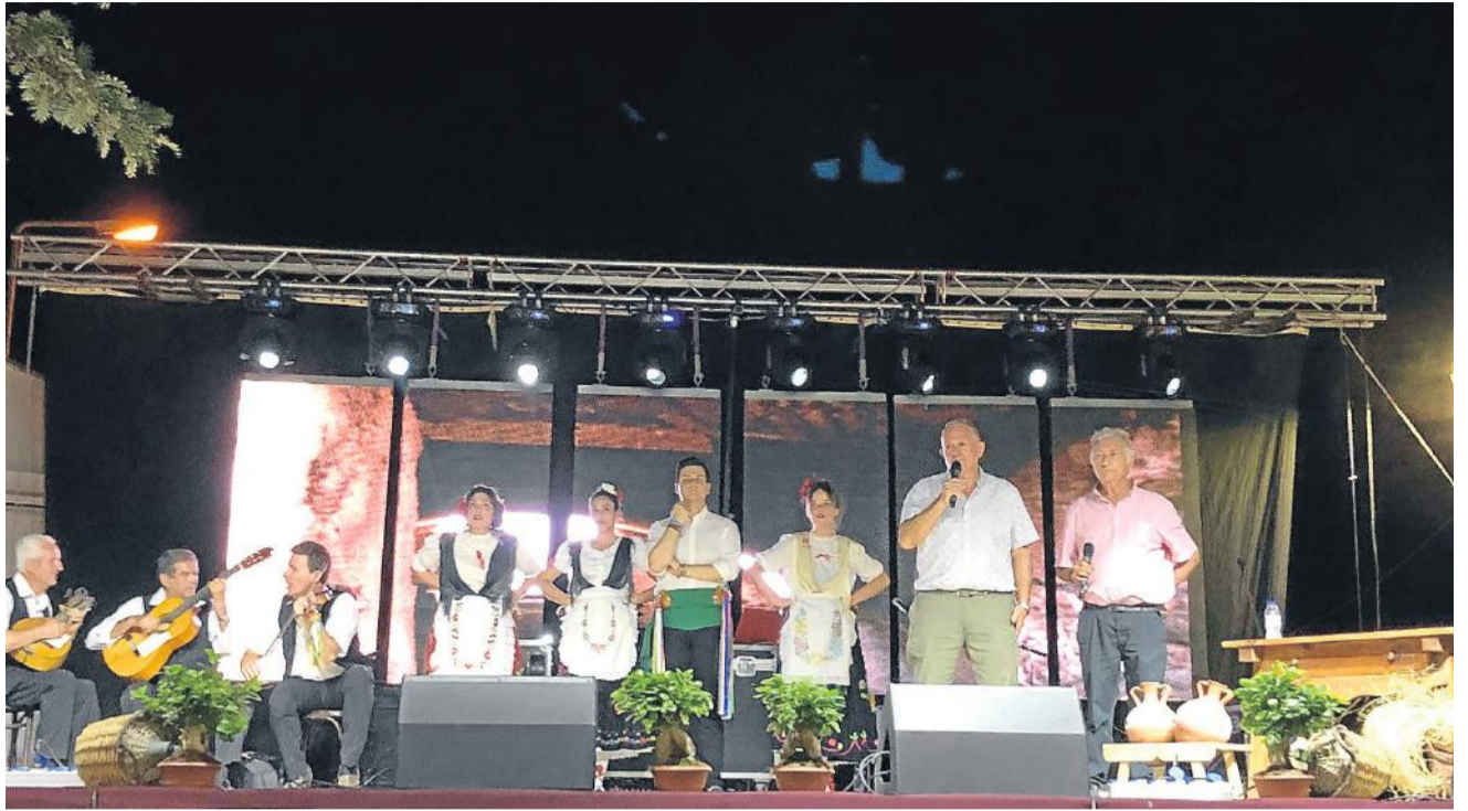
A la izquierda, imagen de la serdinada en Los Lobos. Sobre estas líneas, un momento del Certamen de Trovos.