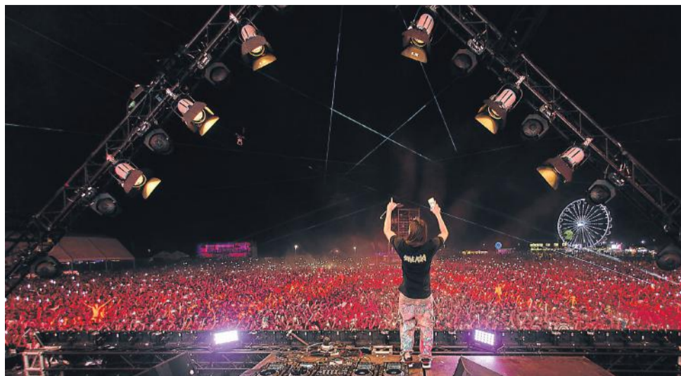
Steve Aoki en el escenario central del festival.

rir' o 'La ocasión', donde colaboraba con De La Ghetto y Ozuna, entre otros. En 2018 lanzó su exitoso álbum 'Real hasta la muerte', que incluyó hits como 'Ella quiere beber' o 'Brindemos'.