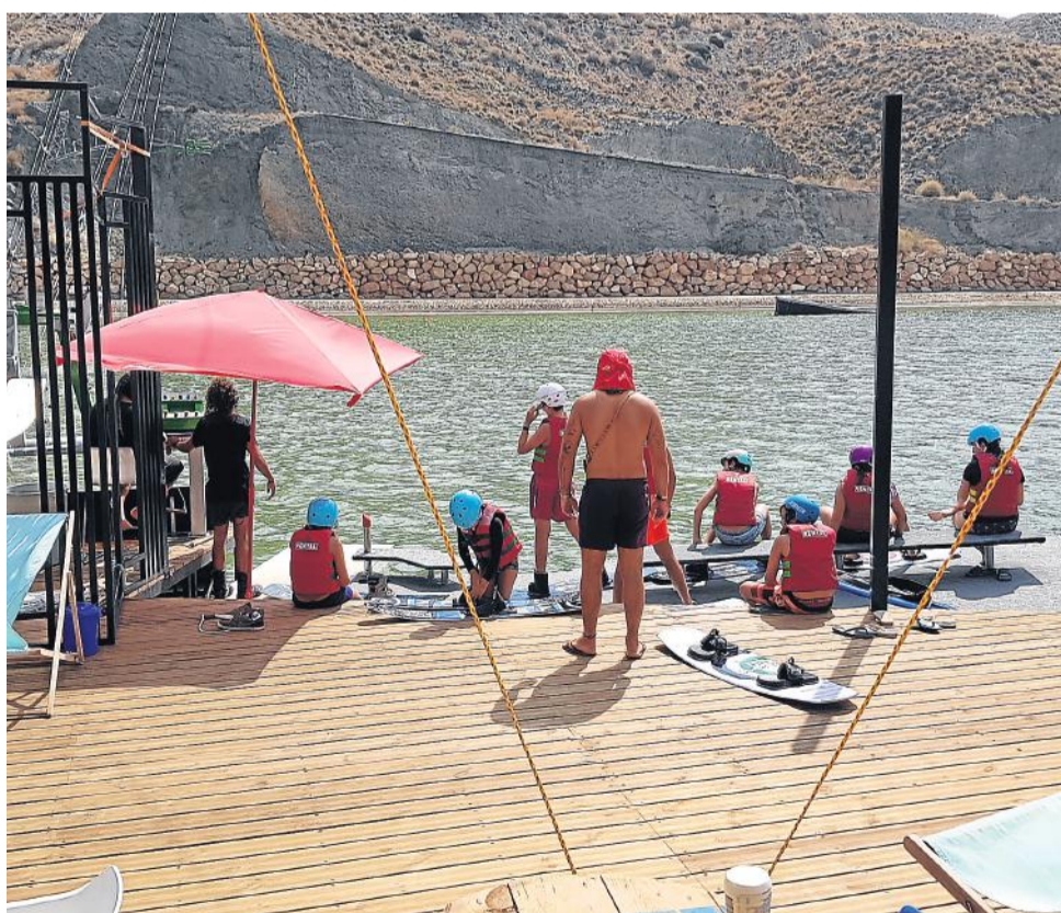
Los más jóvenes disfrutaron de la instalación dentro del campamento que la empresa que gestiona el Canal de Remo ha puesto en marcha este verano, aparte de las actividades para público en general.

La empresa presta diferentes servicios deportivos "con multitud de deportes acuáticos" como wakeboard, wakeskate, waterskiing, kneeboarding o surf, entre otros, y convertirá las instalaciones en una gran área multideportiva.