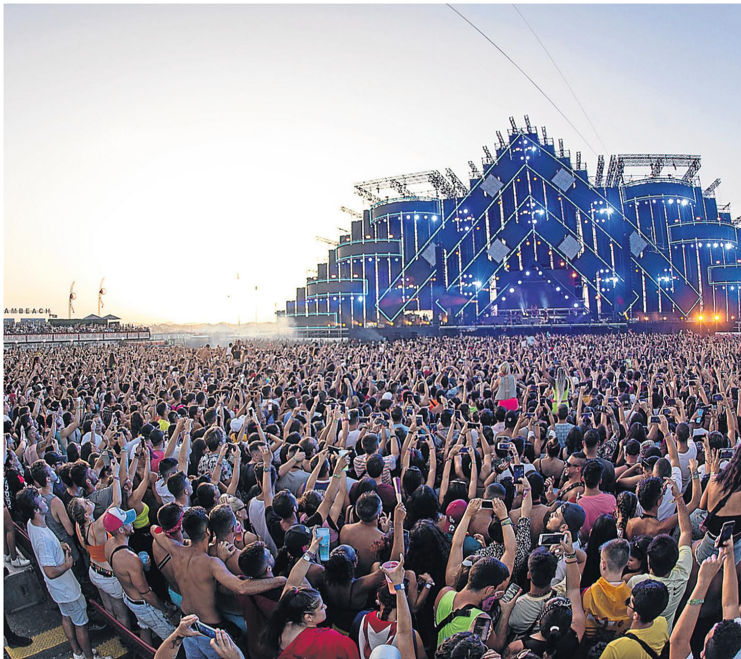
Fuera de cartel actuó Anuel AA, un fenómeno de masas, que llenó el recinto de conciertos del Dreambeach en la tarde del sábado.