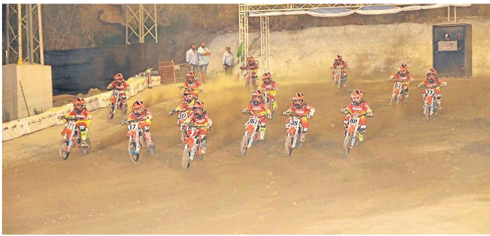
Los pequeños hicieron rugir sus motos como auténticos veteranos.

El Rincón de la Bonil fue un año más el escenario del Campeonato de España de Supercross, cargando la noche de Cuevas del Almanzora de pasión motera, de emoción y de adrenalina, con el rugir de las máquinas de los 48 pilotos que ofrecieron unas trepidantes carreras y un bonito espectáculo. La de Cuevas era la segunda de este 2019 y atrajo a más de 5.500 personas que llenaron las gradas del circuito cuevano