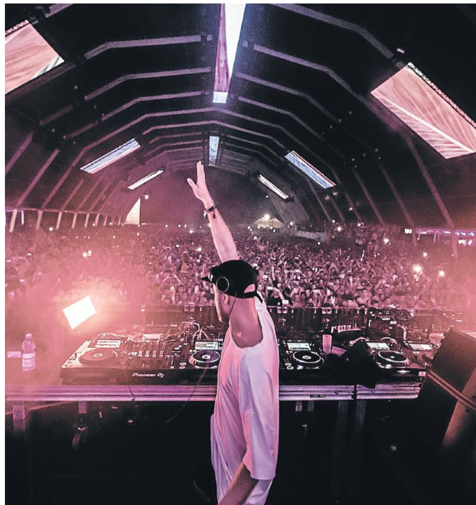
Fisher puso del revés el escenario del Notre Dreams Tent

A través de un anuncio en las pantallas del escenario central, el sábado por la noche también se dieron a conocer las fechas de Dreambeach Villaricos 2020: la 8ª edición se celebrará del 5 al 9 de agosto del año que viene. El gran reto: que el Dj norteamericano Skrillex sea cabeza de cartel.