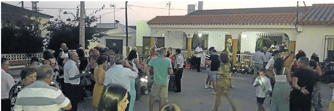
Las plazas y calles de El Largo y Grima se llenaron de fiesta y también de devoción a la Virgen.

Muchos colores y mucha diversión en las fiestas de El Largo y Grima. Acogedoras, con olor a buena comida y con sabor a todo lo tradicional de la tierra.