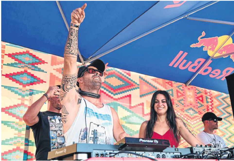
Ness Navarro disfrutó e hizo disfrutar con una sesión que llenó la Pool Area del festival Dreambeach 2019.

Ginés Campoy Navarro, conocido artísticamente como Ness Navarro, volvió a dejar el nombre de Cuevas del Almanzora, su pueblo, muy alto, en el festival de música electrónica más importante del país.