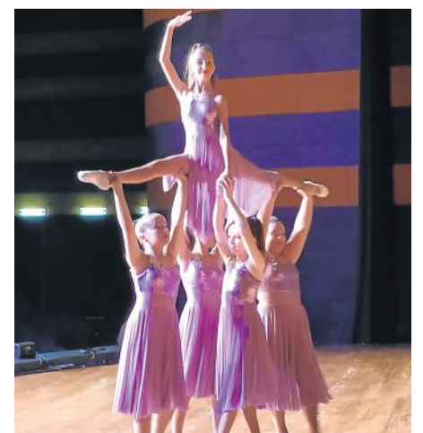
Grupo ganador en Roma.